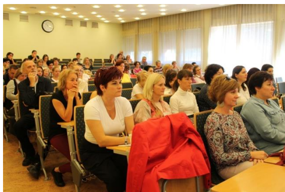
A konferencia résztvevői